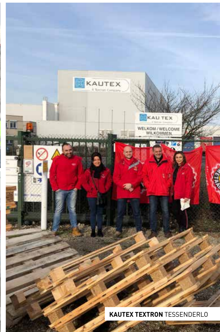
KAUTEX TEXTRON TESSENDERLO